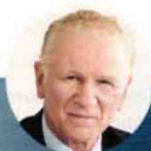
Olivier Challan-Belval Médiateur national de l'énergie

Pour attirer de nouveaux clients, certains fournisseurs, lors d'un démarchage à domicile ou par téléphone, minorent la consommation du foyer afin de proposer une offre aux mensualités nettement allégées. En oubliant de signaler que ces chiffres reposent sur une consommation estimée. Les victimes de ce piège déchantent brutalement en recevant leur première facture de régulation... Une pratique à l'origine d'un nombre croissant de litiges, selon le Médiateur national de l'énergie, qui appelle à la vigilance.